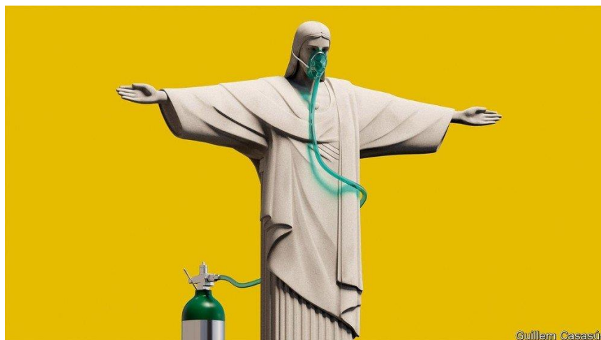
Figura 3 - Imagem do Cristo Redentor na edição de junho de 2021 da The Economist

A capa da edição de junho de 2021 na América Latina nos provoca sobre a necessidade do Brasil se recuperar diante dos desafios impostos pela pandemia da Covid-19 e de reconhecer o que deu errado politicamente.